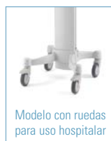
Modelo con ruedas para uso hospitalar