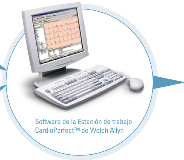
Software de la Estación de trabajo CardioPerfect™ de Welch Allyn