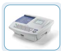
CP 100™ de Welch Allyn Transfiera la información mediante una tarjeta SD