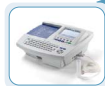
CP 200™ de Welch Allyn Transfiera la información mediante una conexión directa o una tarjeta SD