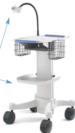
Modelo con ruedas de consulta