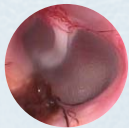
Otoscopio Veterinario MacroView™

Visión casi completa y clarísima de la membrana timpánica – ¡incluso en perros grandes!